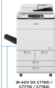
IR-ADV DX C7765i / C7770i / C7780i